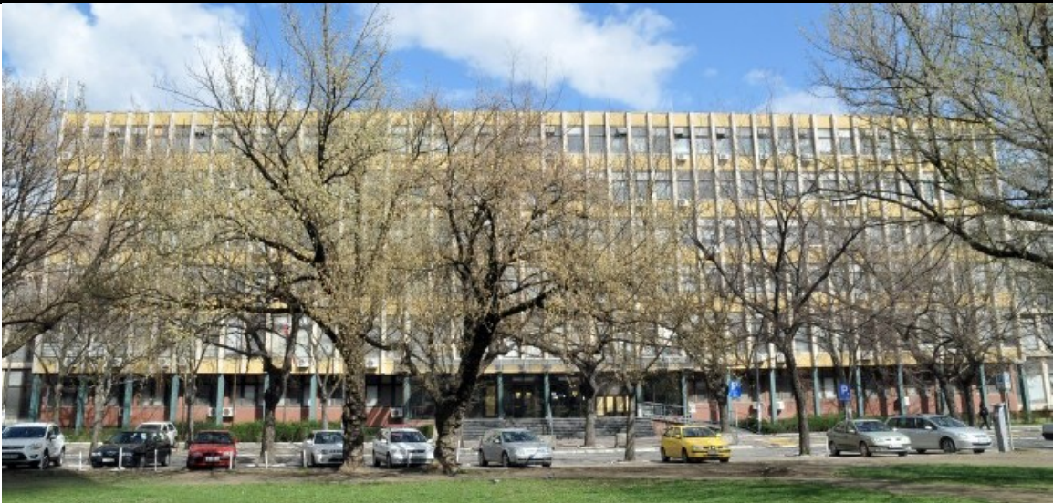
слика 1 - Зграда правосудних органа у Новом Саду у којој се налази Више јавно тужилаштво у Новом Саду